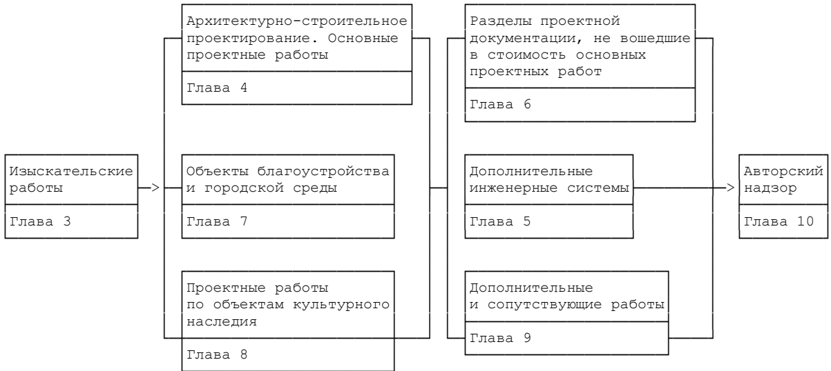
Схема составления сметы на проектные работы по зданию с использованием сборников МРР (справочная)